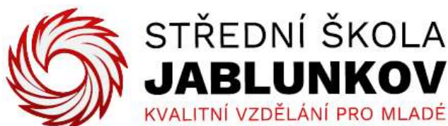
Obr. 4 Logo školy

Obrázky a tabulky menší, než půl stránky mohou být zařazeny do textu. Pokud jsou větší, budou zařazeny do příloh. Obrázky se označují titulkem Obr. č. x a popisem obrázku pod obrázkem (viz Obr. 4).